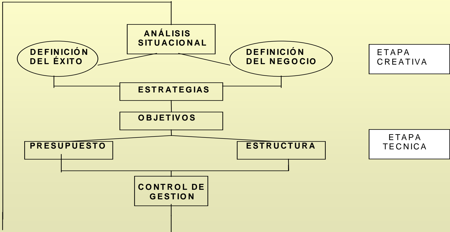
Diagrama de Planeamiento Estratégico