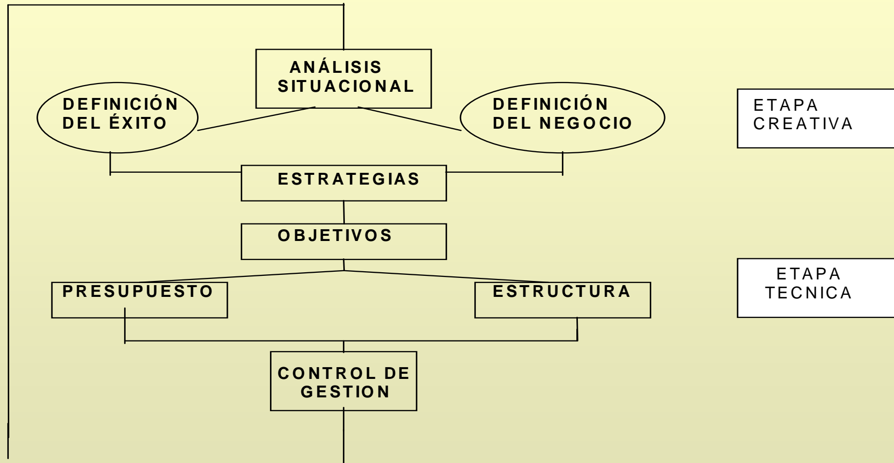
Diagrama de Planeamiento Estratégico